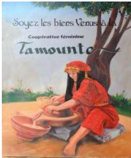
Affiche de valorisation des produits du terroir au Maroc- Argan