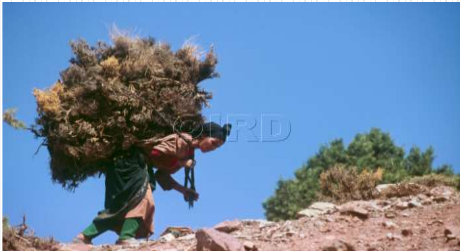
Ramassage du bois dans le Haut-Atlas marocain.