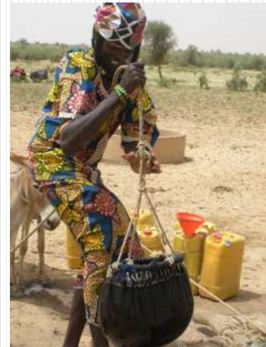
Outre d'eau extraite du puits, Dantiandou, Niger.