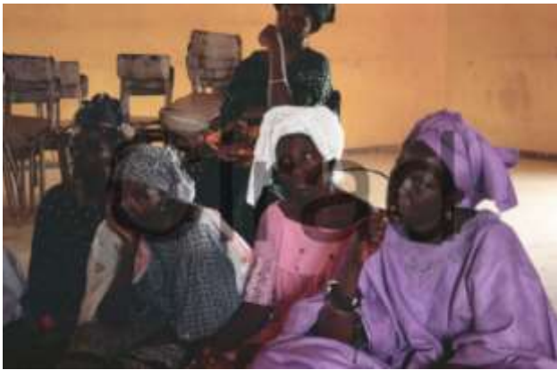
Femmes du Groupement de promotion féminine de Kaffrine. Sénégal.