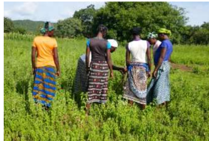
Groupement de femmes productrices de karité. Burkina Faso.