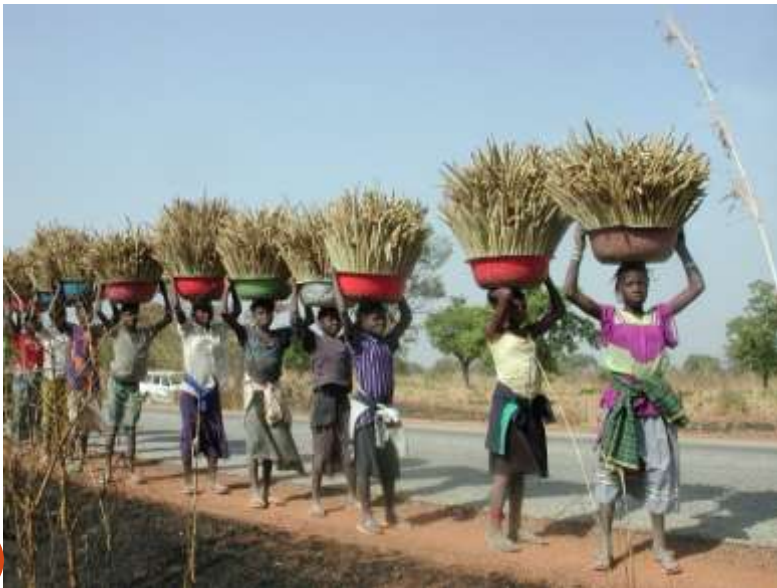
Le mil en route, Burkina Faso.